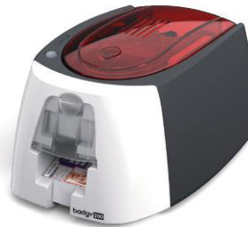
Impresora de tarjetas identificativas Badgy