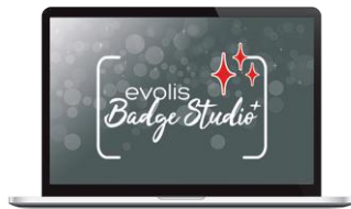
Software de personalización de tarjetas Evolis Badge Studio®