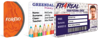
Biblioteca de plantillas en línea